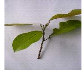
Pucuk yang sudah dipotong