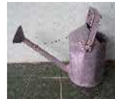
Embrat atau gembor

Embrat merupakan alat penyiram berupa ember bermoncong yang berlubang sebagai tempat keluarnya air secara merata. Alat ini digunakan secara rutin dalam kegiatan pemeliharaan bibit.