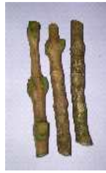
Stek siap untuk induksi akar atau pengakaran