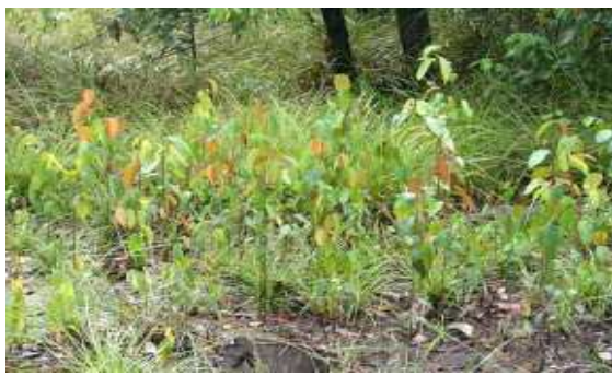
Anakan Belangeran Shorea balangeran banyak dijumpai pada lahan gambut bekas terbakar di tepi Sungai Puning, Barito - Kalimantan Tengah