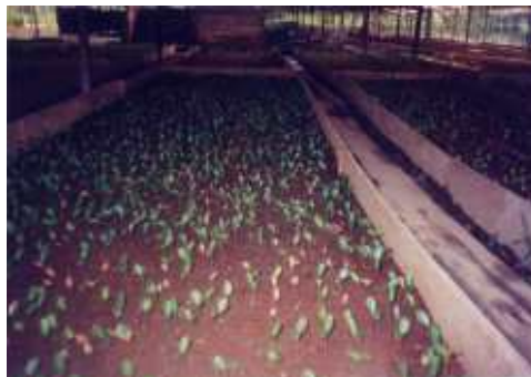
Bedeng tabur dengan kecambah Jelutung di dalamnya

Bedeng tabur khusus dipakai untuk mengecambahkan biji, terutama biji yang berukuran kecil. Bedeng kecil ini dapat berupa kotak dengan ukuran bervariasi yang didalamnya terdapat media kecambah (biasanya pasir). Media