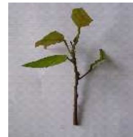
Stek setelah dikurangi daunnya

halus. Potongan yang halus ini akan mempermudah keluarnya akar pada stek. Untuk mempercepat terbentuknya akar, sebaiknya diberi hormon pertumbuhan (misal: Rootone F ). Sedang dalam pembuatan stek pucuk Meranti, stek diambil dari anakan alam atau kebun pangkas yang dipelihara. Bagian yang diambil adalah bagian pucuk yang menghadap ke atas ( orthotrop ) dan mempunyai 2-4 daun. Pemotongan dilakukan pada bawah nodul dengan menggunakan gunting stek yang tajam. Pengurangan daun sebaiknya dilakukan dengan menyisakan 1/3 atau 1/2 bagian saja. Selanjutnya, stek diberi hormon pertumbuhan pada bagian pangkalnya (misal: Rootone F ).