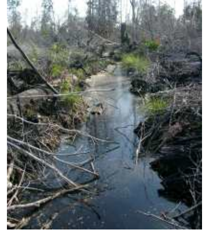
Parit di Muara Puning, Kalimantan Tengah