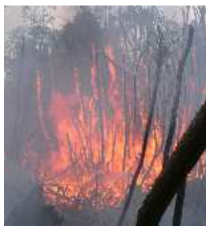
Kebakaran hutan gambut di Mentangai, Kalimantan Tengah

Kebakaran hutan dan lahan gambut menjadi fokus utama kejadian kebakaran saat ini mengingat dampak asap dan emisi karbon yang dihasilkan. Hutan rawa gambut seluas 2.124.000 hektar telah terbakar pada kejadian kebakaran 1997/1998 (Tacconi, 2003), mengemisikan sekitar 156,3 juta ton karbon ke